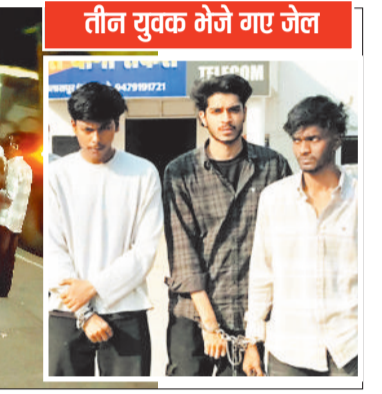
तीन युवक गेजे गए जेल