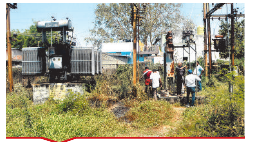
इंदिरा विहार कालोनी के अंदर सीएसबी के विद्युत सब स्टेशन के चारो ओर झाड़ियां उग आई।

बिल्हा | मस्तूरी | तखतपुर | मुंगेली | कोटा | लोरमी | सरगांव | पेंड़ा | बेलतरा | रतनपुर | पथरिया