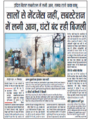
हरिभूमि में प्रकाशित खबर।

खास बात यह है कि सबस्टेशन में सालों से मेंटनेंस नहीं किया गया था, जबकि इस बारे में ठेकेदार को कई बार नोटिस जारी किया गया लेकिन इसके बाजवूद लापरवाही बरती गई थी।