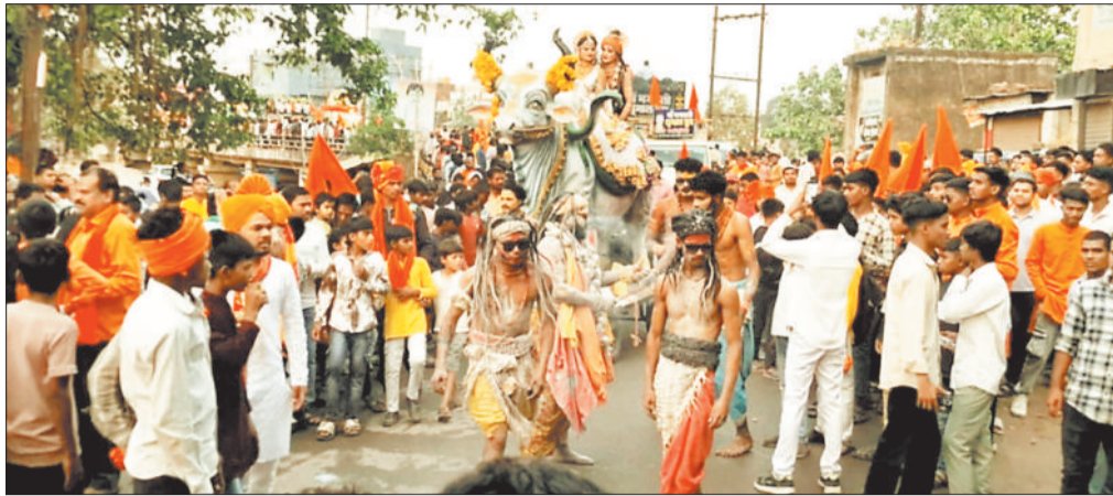
शोभायात्र में नंदी पर सवार शिव पार्वती की झांकी।

कांग्रेसियों ने किया स्वागत- नगर के पुल पारा में कांग्रेसियों ने शोभायात्रा का भव्य स्वागत किया। इस दौरान बड़ी संख्या में कांग्रेसी कार्यकर्ता मौजूद रहे। आयोजन समिति के पदाधिकारियों ने जानकारी देते हुए बताया कि, शोभायात्रा में माता शक्ति की झांकियां, देवी-देवताओं के सजीव चित्रण और पारंपरिक वेशभूषा में सुसज्जित महिलाएं एवं युवा आकर्षण का केंद्र रहे। ढोल-नागाड़े, बैड-बाजों और भक्ति गीतों के बीच श्रद्धालुओं ने पूरे उत्साह के साथ यात्रा में भाग लिया। हेमू कलाणी चौक पर रैली का स्वागत- हिंदू नववर्ष पर इस आयोजन को लेकर विशेष उत्साह है। प्रशासन की ओर से भी आयोजन को शांतिपूर्ण एवं व्यवस्थित ढंग से संपन्न कराने के लिए सुरक्षा के पुख्ता इंतजाम किए गए हैं। यातायात व्यवस्था को सुचारु बनाए रखने के लिए विशेष योजना बनाई गई है, ताकि आमजन को किसी प्रकार की असुविधा न हो।